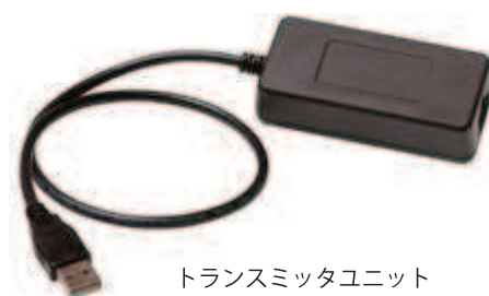
トランスミッタユニット