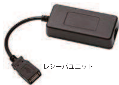
レシーバユニット