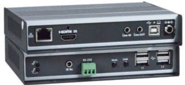
XTENDEX® ST-IPUSB4K-VW (ローカルおよびリモートユニット)