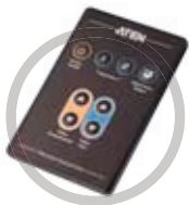
IRリモート コントロール