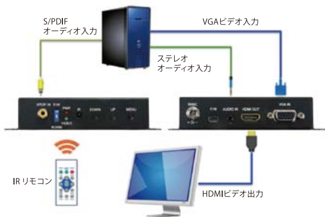
VGA-HDMIトランスレータの接続ダイアグラム

アプリケーション例: VGA-HDMIトランスレータのための他のアプリケーション環境は、ショッピングセンター、コントロールルーム、ディーラールーム、レストラン、病院、セキュリティなどがあります。