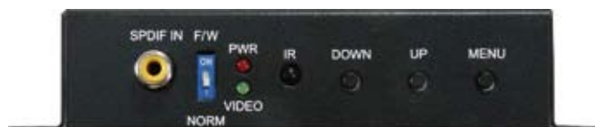
VGA-HDMIトランスレータ フロントパネル

標準のオーディオおよびビデオケーブルを使用して接続すると、トランスレータは、ハンドヘルドのIRリモートの使用、またはMiniUSBポート経由でPCを接続してOSDメニューを操作することによって簡単に構成および操作ができます。出力モニタにDVIインターフェースが装備されている場合、インターフェースを変換するには、HDMI-DVIアダプタケーブルを使用します。