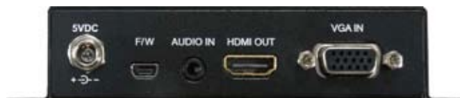
VGA-HDMIトランスレータ リアパネル