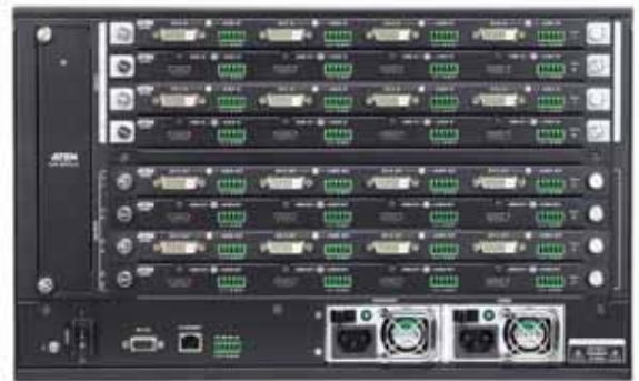
VM1600 (リア) ※ I/Oボード搭載時