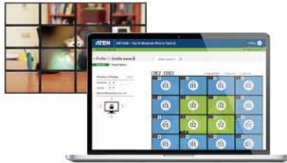
ビデオウォール設定画面