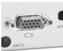
HDMI and VGA display