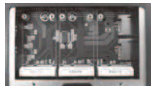
3 PCIe Mini Card slots and 2 SIM slots