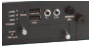
Removable CFast™, SIM slot and suspension 2.5" SATA HDD/SSD