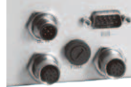
M12 railway power input and two Gigabit LAN connectors