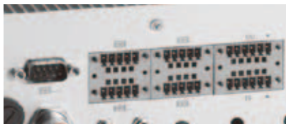
RS-232 (4-Wire)/422/485 and DIO ports