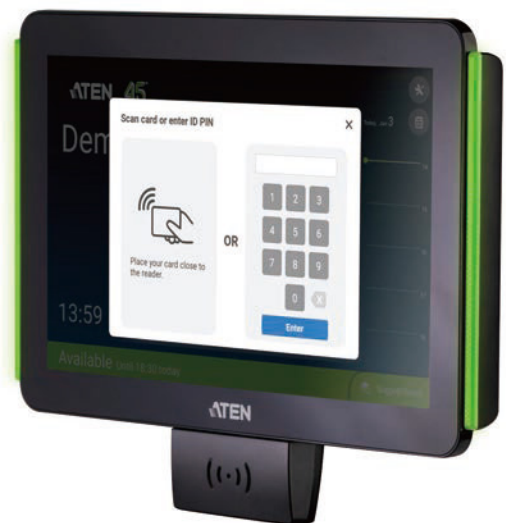
VK430 + VK401